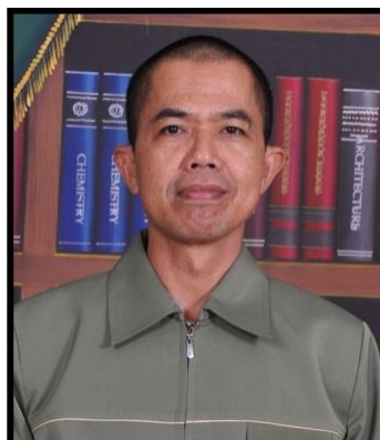
KA. PRODI MPI