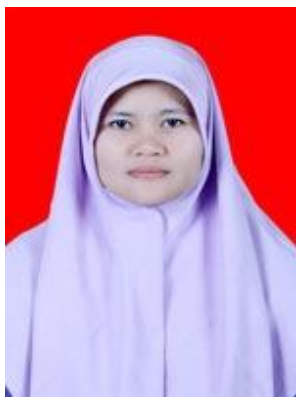
KA. PRODI PGSD