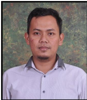
WAKIL DEKAN I