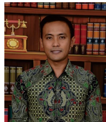
KA. PRODI PBA