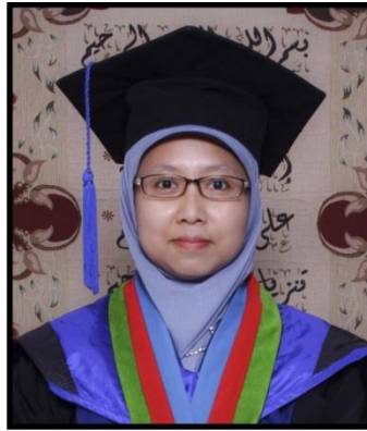
WAKIL DEKAN II