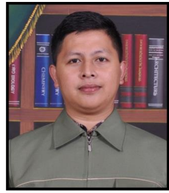
WAKIL DEKAN III